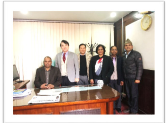
मा. उपप्रधानमन्त्री श्री उपेन्द्र यादवसंग शिष्टाचार भेटघाट